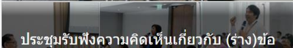
ประชุมรับฟังความคิดเห็นเกี่ยวกับ (ร่าง)ข้อ